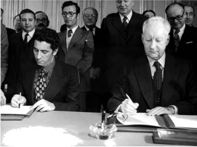
صورة تجمع بين رئيس الوزراء الفرنسي بيير ميسمير ونظيره الليبي عبد السلام جلود في فندق ماتينيون بباريس، فرنسا، 19 / 2 / 1974.